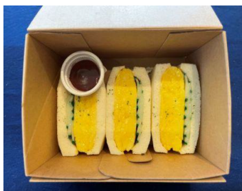
厚焼き玉子サンドイッチ