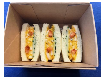
タマゴサンドイッチ