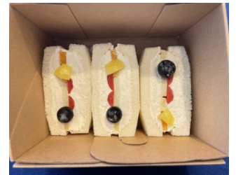
フルーツサンドイッチ