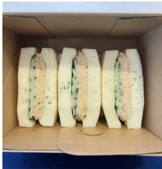
ツナサンドイッチ