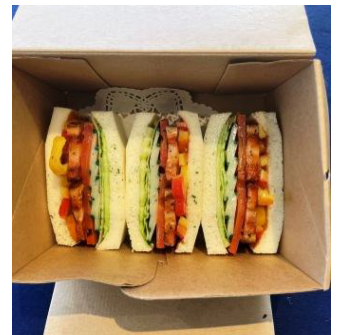
厚切りベーコンマサンドイッチ