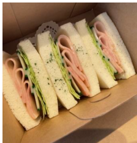
ハムサンドイッチ