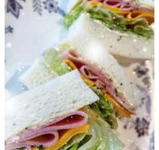
チーズハムサンドイッチ