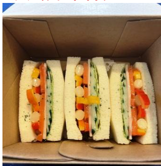
野菜サンドイッチ