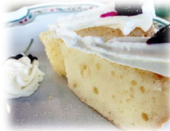
プレーンシフォン

シフォンケーキはプレーン種類を 常時ご用意致しております。 季節毎に限定ケーキを提供する予定です。